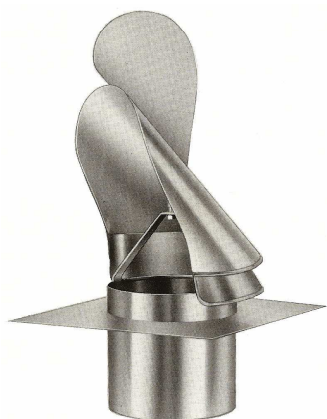
Otočná hlavice "JOHN "