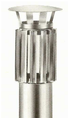
Lapač jisker "PALA"