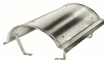
Komínové krytí " NAPOLEON " C